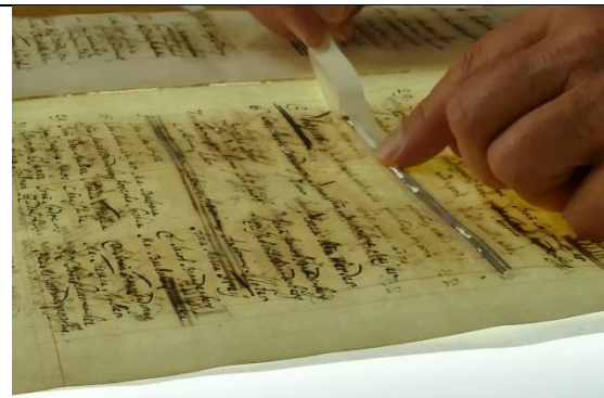
Der Japanpapierstreifen wird vom Silikonpapier abgezogen und auf die Fehlstelle gelegt