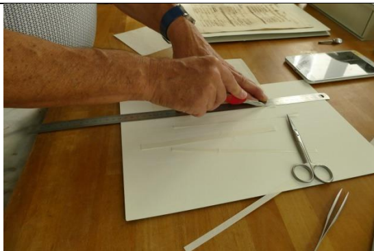
Das auf dem Silikonpapier klebende Japanpapier wird in Streifen geschnitten (Japanpapier liegt oben)