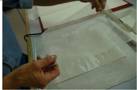
Japanpapier auf den getrockneten Acrykleber auflegen