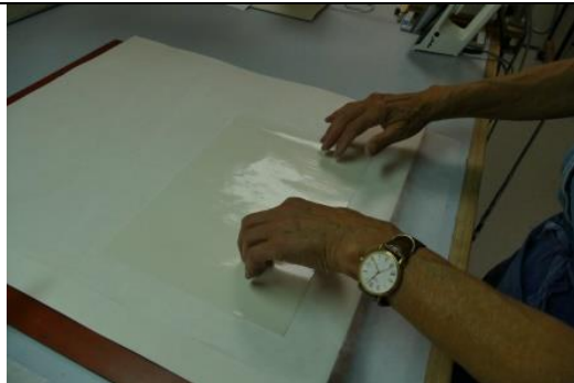
Silikonpapier mit dem aufgeklebten Japanpapier ist um 180° gewendet und liegt nun auf der Heizplatte