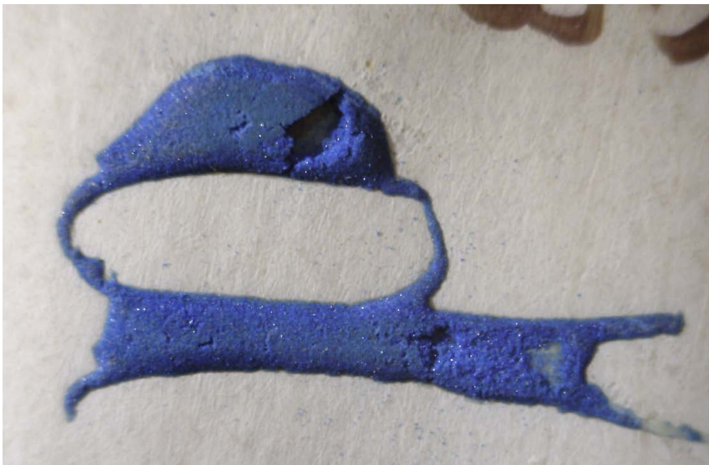
nachher: Folio 22: Nach der Festigung ist der Buchstabe optisch nahezu unverändert.