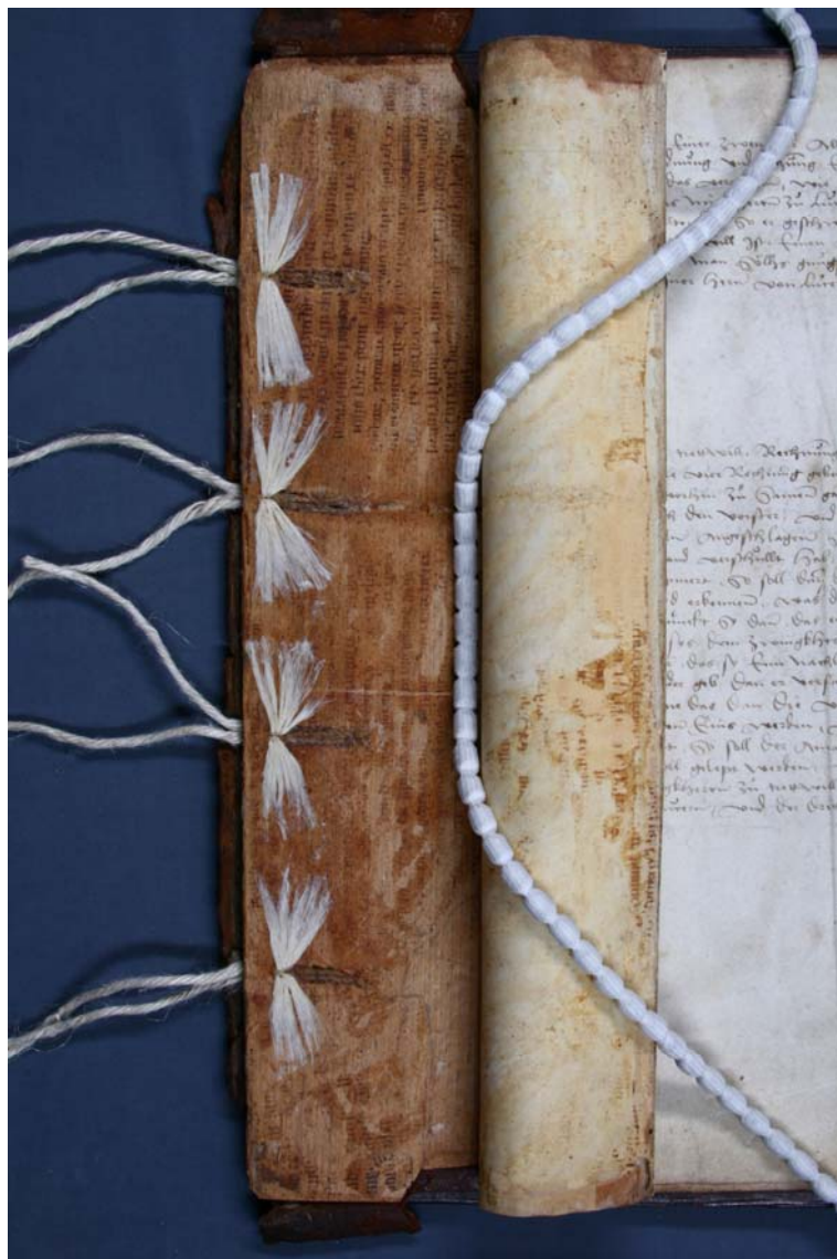
Abb. 1 In der Mitte der vom Deckel abgelöste Spiegel nach hinten gerollt und mit einer Bleischnur beschwert.

Beim Ablösen eines auf einen Holzdeckel geklebten Pergamentspiegels einer mittelalterlichen Handschrift mussten wir den Spiegel etwa 7 cm breit im Bereich der Falzkante ablösen.