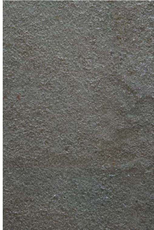
Abb. 3 Die Struktur des Pergamentes nach dem Ablösen mit GoreTex.

Eure Erfahrungen würden mich sehr interessieren. Ich denke, dass es auch sehr stark auf das jeweilige Pergament ankommt, ob und wie stark sich die Oberflächenstruktur ändert.