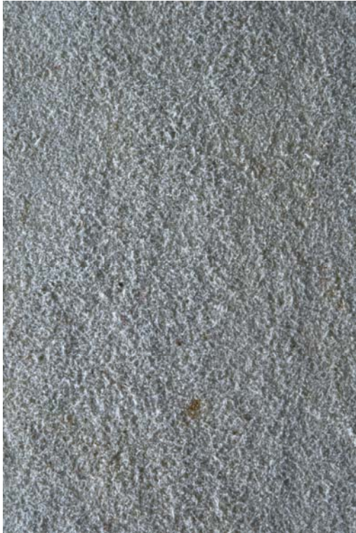
Abb. 2 Die noch nicht abgelöste samtige Oberflächenstruktur. Wenn man mit den Fingern über die beiden Stellen streicht, ist der Unterschied noch spürbarer als auf dem Foto.

Dies erfolgte mit Gore Tex und mit Wasser befeuchtetem Polyestervlies (capillary matting). Sobald das Pergament etwas feucht war und es sich vom Deckel ablösen liess, wurde es vom Holzdeckel abgezogen. Nach dem Trocknen stellte sich heraus, dass visuell ein erheblicher Unterschied zwischen dem abgelösten Pergament und dem noch klebenden Teil des Spiegels bestand. Wenn man mit den Fingern über das Pergament fährt, spürt man einen sehr grossen Unterschied. Der Teil des Pergamentes, der abgelöst wurde, ist flach, die samtige Struktur ist gänzlich platt (Abb. 3), während das Pergament des nicht abgelösten Teils sich noch schön samtig anfühlt (Abb. 2).